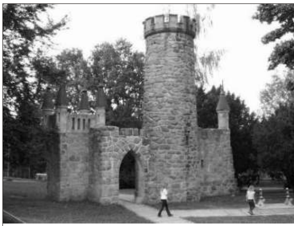
Františkolázeňská rozhledna Salinburg