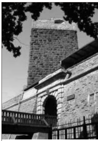
Černá věž na Chebském hradě