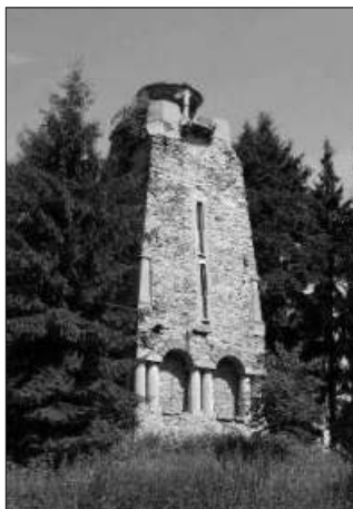
Bismarckova rozhledna u Chebu