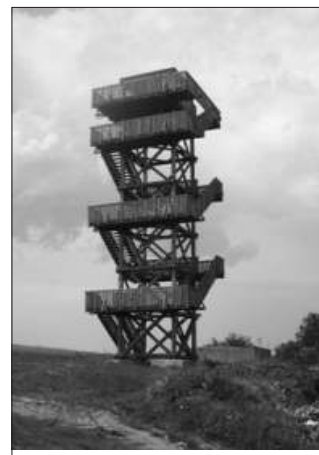
Rozhledna u Strejců v Lubech