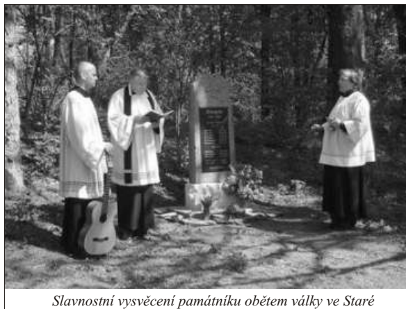
Slavnostní vysvěcení památníku obětem války ve Staré

Myšlenka obnovit poškozený památník obětem války se zrodila 30. dubna 2006, kdy skupina mladých lidí, potomků bývalých obyvatel Staré (Altengrün), při pátrání po vlastní minulosti našla v křoví na území bývalé vsi povalenou stělu pomníku obětem 1. světové války.