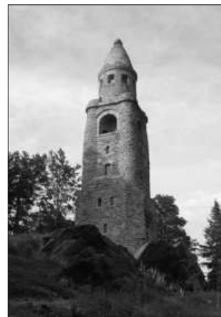
Bismarckova rozhledna na Háji