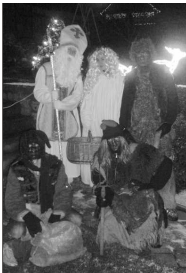
Večer zavítal svatý Mikuláš se svými pomocníky do ulic. A jak je vidět, čertů bylo i letos potřeba víc než andělů.