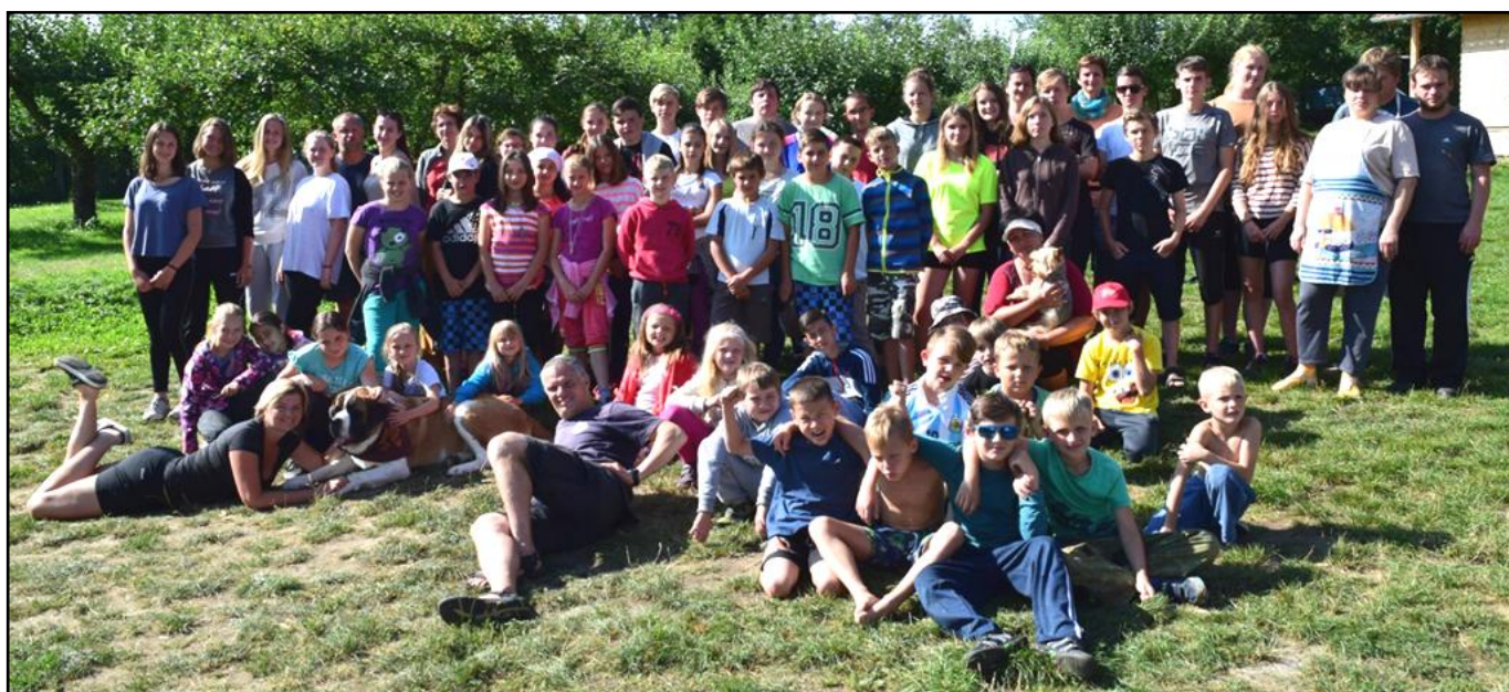
Účastníci tábora - Příchovice 2016