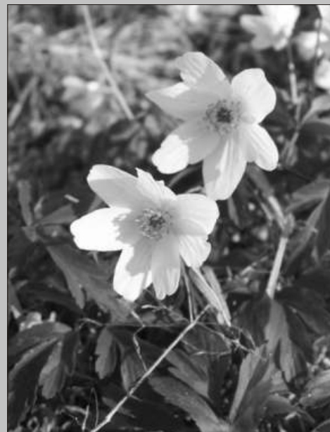
Zatímco loňské Velikonoce nám nadělily hromadu čerstvého sněhu, ty letošní už probíhaly ve znamení skutečného jara.