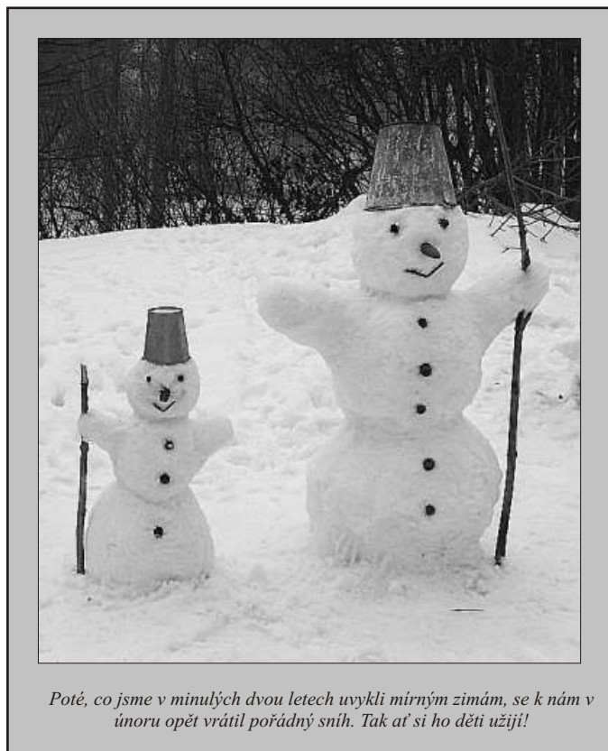
Poté, co jsme v minulých dvou letech uvykli mírným zimám, se k nám v únoru opět vrátil pořádný sníh. Tak ať si ho děti užijí!