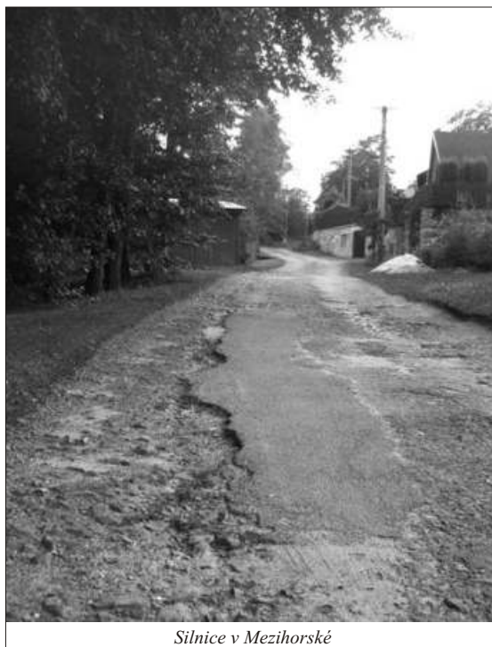
Silnice v Mezihorské

dokončena. Od roku 2004 vyřizujeme přidělový majetek obce, kde zpracování 3 katastrů stálo 57 000,- Kč a zaměření lesních pozemků (zatím 65 ha) bude obec stát 480 000,- Kč. V letošním roce jsme obdrželi dotace z Karlovarského kraje na již zmíněný vodovod, dále 30.420,- Kč na nákup ochranných oděvů pro hasiče a 2 700,- Kč na nákup nových sazenic pro zalesňování obecních lesů po kalamitě (celkem stály sazenice 37 870,- Kč). Obec žádá o dotace každý rok, ale jenom v takové výši, aby vždy mohla uhradit zbylou část do 100% z