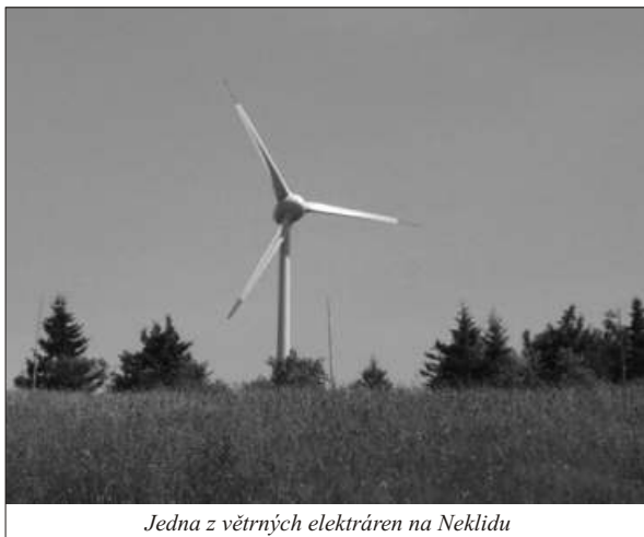
Jedna z větrných elektráren na Neklidu

3 větrné elektrárny typu Enercon s výkonem 2 MW tu stojí teprve 4 měsíce. Jejich chod je pomaloběžný.