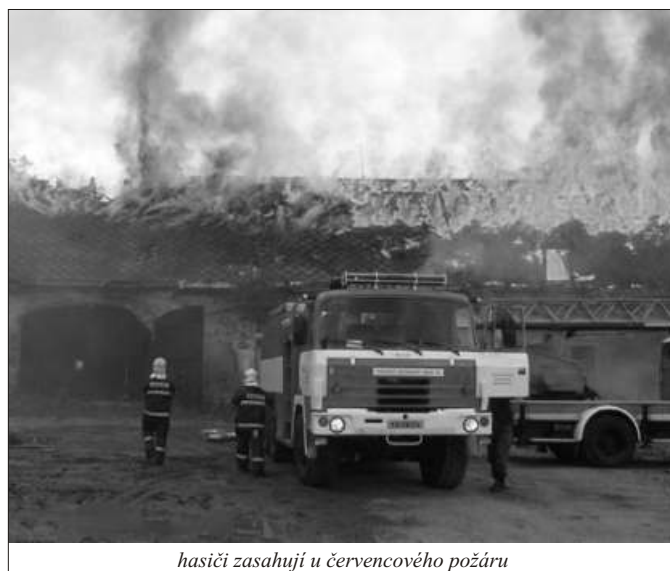
hasiči zasahují u červencového požáru

Příčinou požáru byla neopatrnost zaměstnanců organizace, kteří v objektu prováděli svářečské práce. Jejich