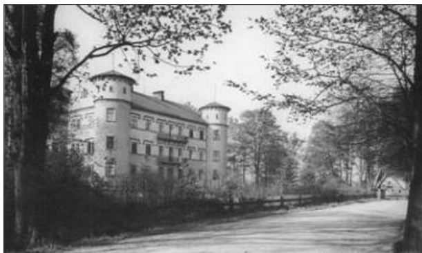
Jindřichovický nosticovský zámek v roce 1929

Rozsáhlé zámecké sklepy měly široké vchody, vnitřku pivních sklepů se