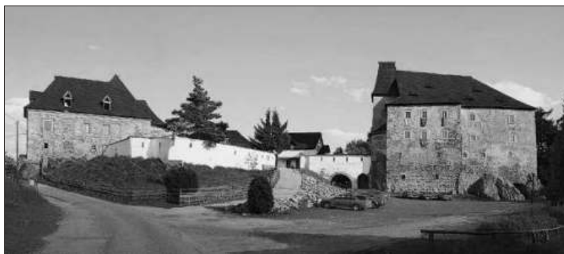
Hrad Vildštejn ve Skalně