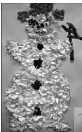
D1 - Verunka