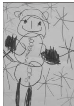
D1 - Sophie