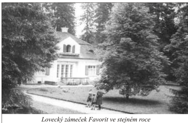
Lovecký zámeček Favorit ve stejném roce

dosáhlo bez schodů. V přední budově bývala dříve kaple (dnes je tu ještě věžka bez zvonu). Po dobu stavby kostela roku 1802 se tu sloužily bohoslužby. V letech 1736 - 1840 byl zámek renovován pod vedením architekta Filause. Báně na nárožních věžích zmizely, místo hladkých stran čtyřhranné střechy byly vztyčeny stupňovité štíty a k pokrytí bylo použito silných žulových desek.