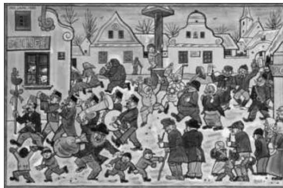
Masopustní rej z časů Josefa Lady

Prežůvky nechte doma, dobrou náladu vezměte s sebou.