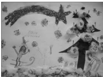
D2 - Milan