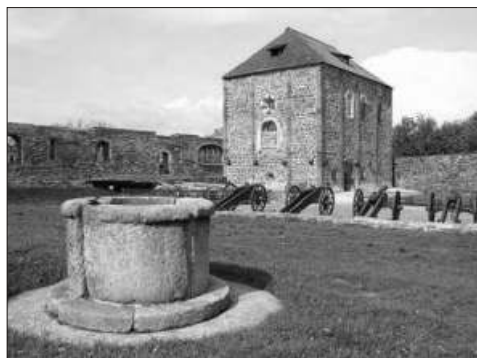
Nádvoří chebského hradu s kaplí