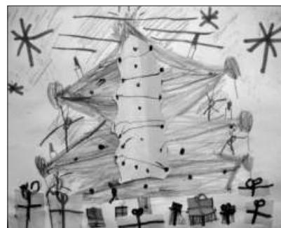
D2 - Kačka