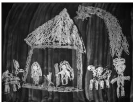
D2 - Jakub