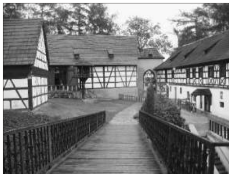
Hospodářské budovy hradu Seeberg

Ostroh (Seeberg) - byl založen okolo roku 1200. Po připojení Chebska k českému království se stal jeho významnou oporou. Za třicetileté války byl dobyt a vyplněn Švédy. Od roku 1703 byl v majetku města Chebu, sloužil jako obydlí chudiny a chátral. Částečně zrekonstruován byl před 1. sv. válkou, po roce 1945 však opět zpustl. Celkové obnovy se dočkal až ke konci 20. století. ( http://web.telecom.cz/muzeum_fl/frame1cz.htm )