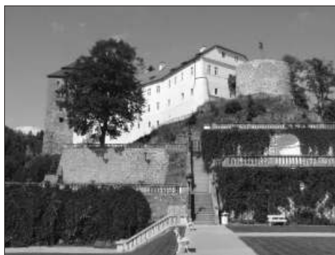
Bečovský hrad a zámecké zahrady