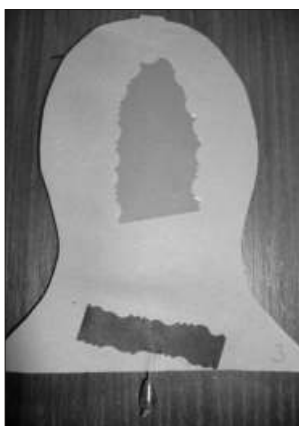
D1 - Eliška