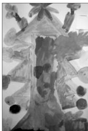
D1 - Jiřík

kategorií. V lednu proběhlo vyhodnocení soutěže, na kterém se mohli podílet všichni návštěvníci knihovny.