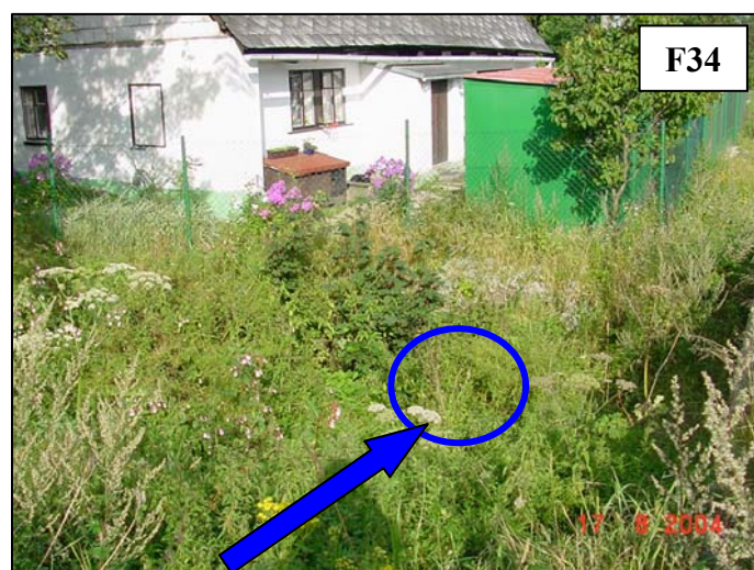
Začátek zatrubnění cca 30 m. Nebezpečí usazování plavenin a ohrožení objektu čp. 197.