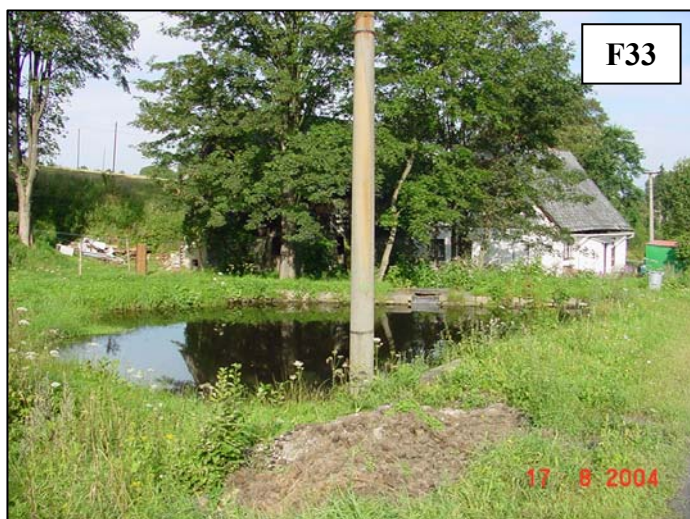
Ohrožený objekt č.p. 197.