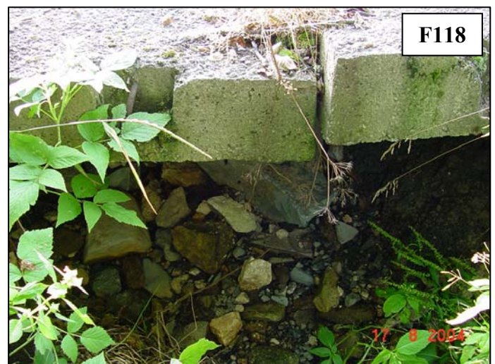
Betonové panely na koruně hráze podemlety přetékající vodou přes hráz.