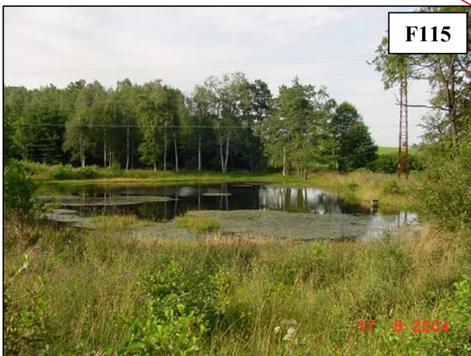
Pohled na hráz rybníka U Bartoše I.

Při prudkých přívalových deštích je nebezpečí protržení hráze a ohrožení objektů v obci.