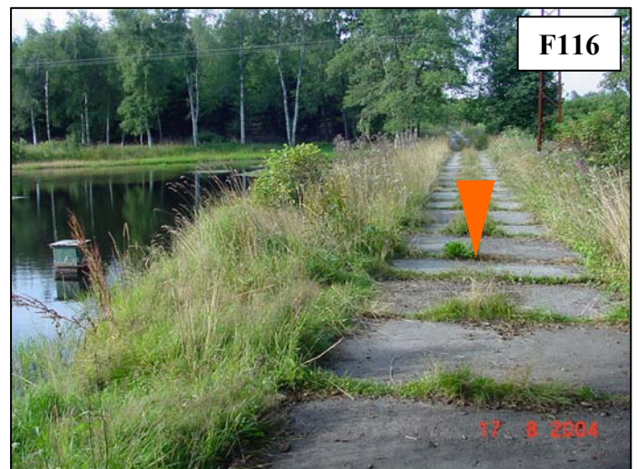
Koruna hráze s označením nejnižšího bodu hráze.